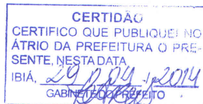
HÉLIO PAIVA DA SILVEIRA Prefeito Municipal